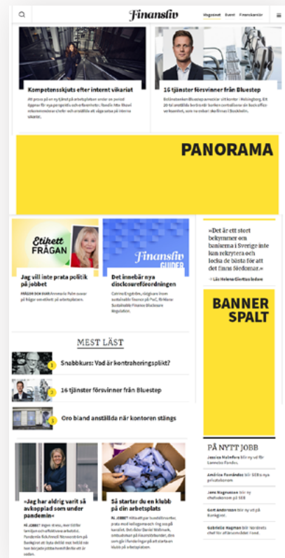
Annonsplatser på finansliv.se